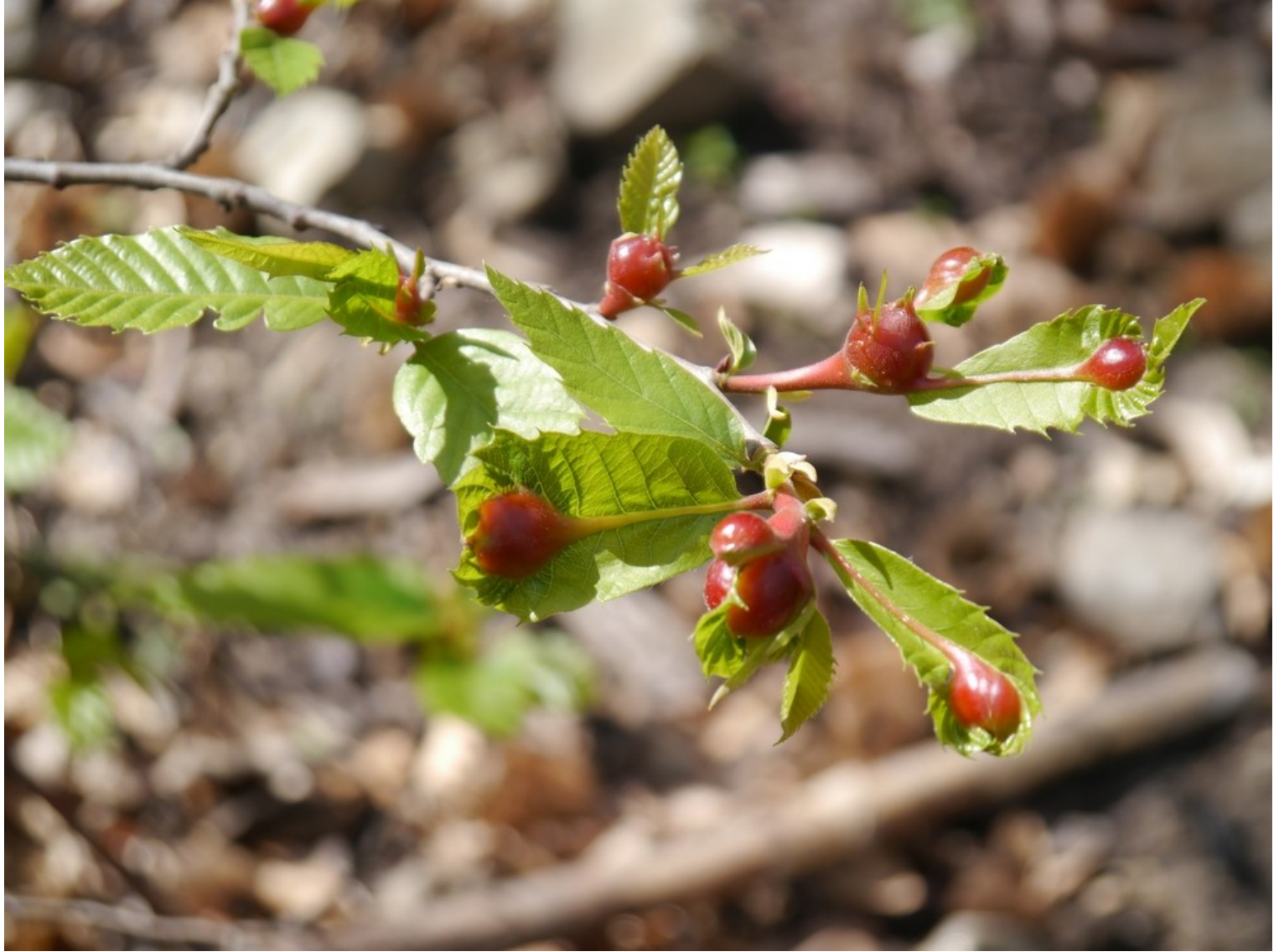
Jeune rameau de châtaignier infesté