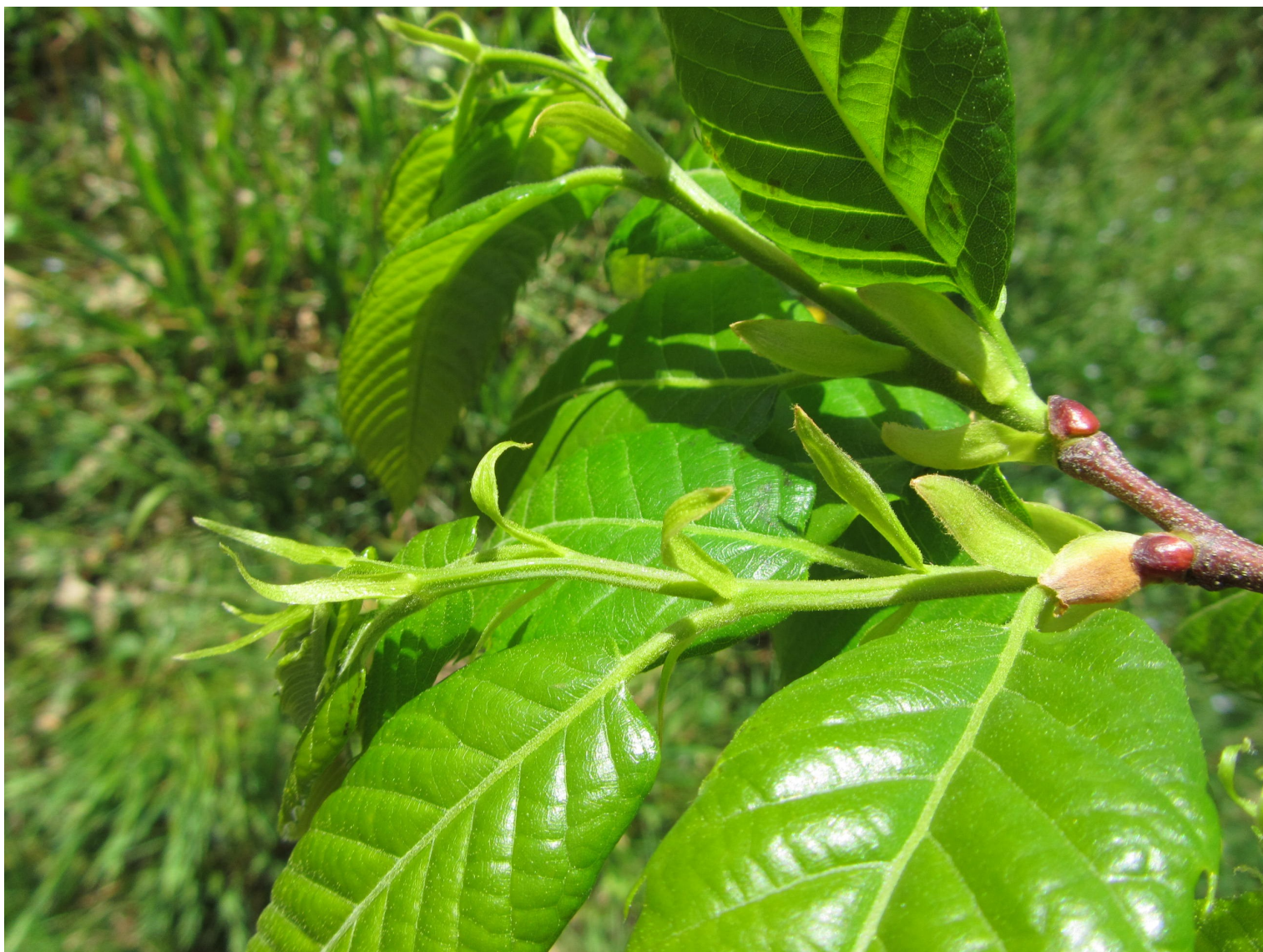
Jeune rameau de châtaignier sain