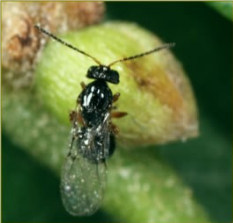
Cynips en train de pondre sur bourgeon