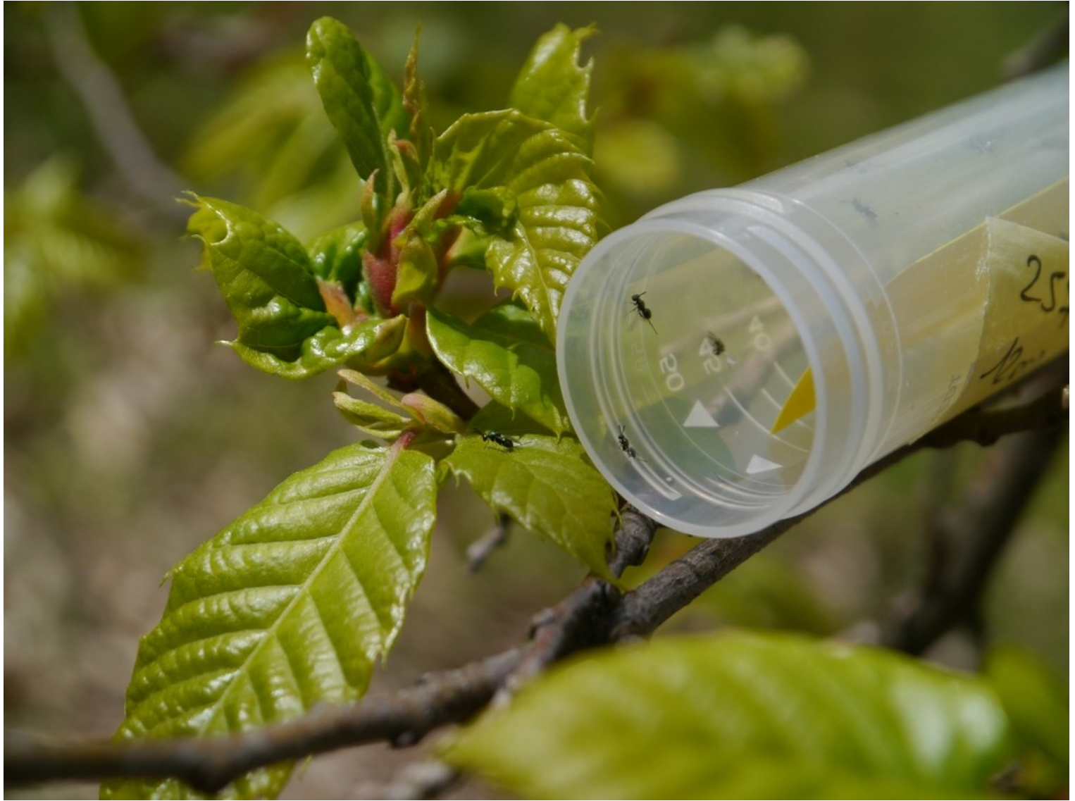
Lâcher de Torymus